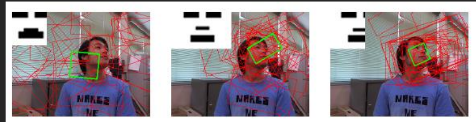
GAの世代交代(個体集団の収束)の様子