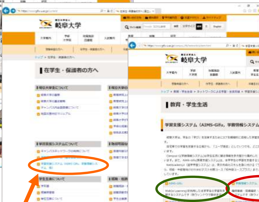
② 「学習支援システムについて (AIMS-Gifu, 学務情報システム ほか)」