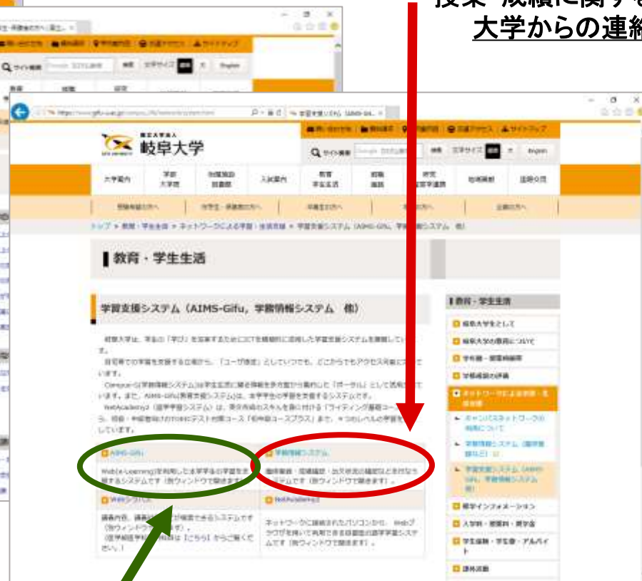
③ 「AIMS-Gifu」はこちら 授業関係・教員との連絡