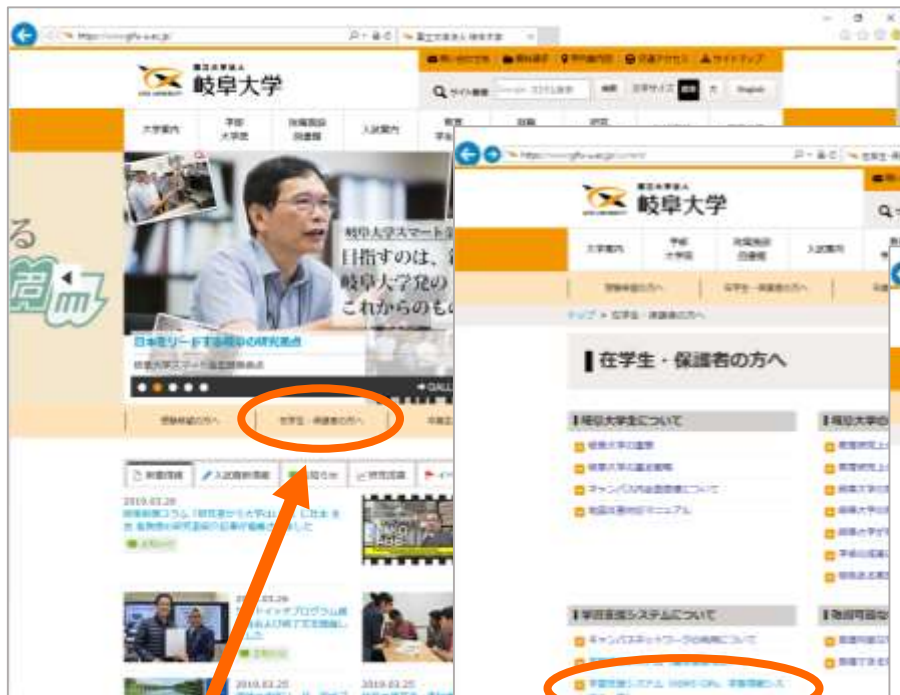
① 「在校生・保護者の方へ」